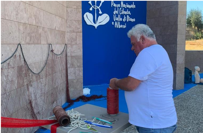
Come si costruisce una rete da pesca...