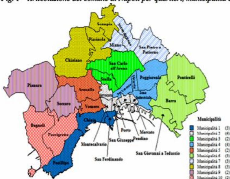
Fig. 1 – Articolazione del comune di Napoli per quartieri, municipalità e macro-aree

Nota: Centro storico = Chiaia, San Ferdinando, Mercato, Pendino, Avvocata, Montecalvario, Porto, San Giuseppe, San Carlo all'Arena, Stella, San Lorenzo e Vicaria; Collina = Vomero e Arenella; Est = Poggioreale, Zona industriale, Ponticelli, Barra e San Giovanni a Teduccio; Nord = Miano, Secondigliano, San Pietro a Paterno, Piscinola, Chiaiano e Scampia; Ovest = Posillipo, Soccavo, Pianura, Bagnoli e Fuorigrotta.